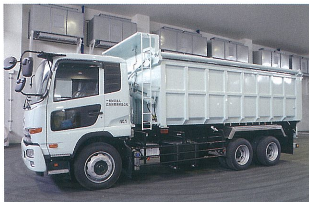
場内専用の密閉型ダンプトラック