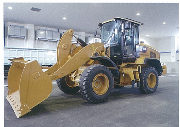
ホイールローダー